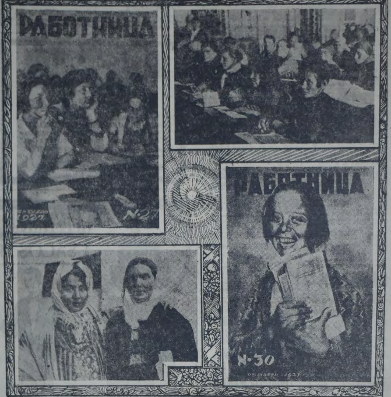
VEAMOS AQUI REPRODUCIDAS DOS TAPAS DE LA REVISTA "RABOTNITSA" ("LA MUJER OBRERA"), ORGANISMO DESTINADO A TRATAR los problemas de interés para las mujeres proletarias de la Unión de los Soviets...